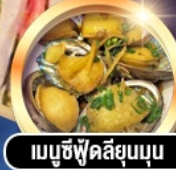
เมนูซีฟู้ดลิ้นยุบนุ่ม