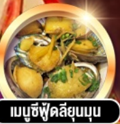
เมนูซีฟู้ดลิ้นจี่