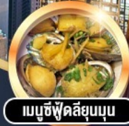
เมนูซีฟู้ดลิ้นจี่นูนูน