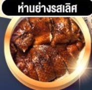
हांอย่างรสเลิศ