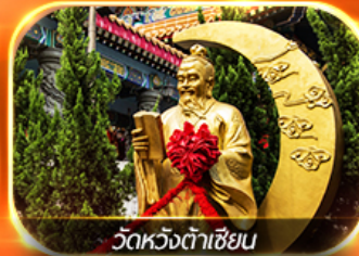
วัดหวังต้าเซียน