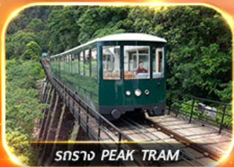
รถราง PEAK TRAM