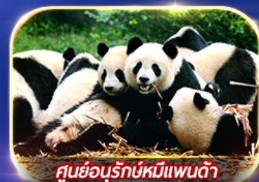
ศูนย์อนุรักษ์หมีแพนด้า