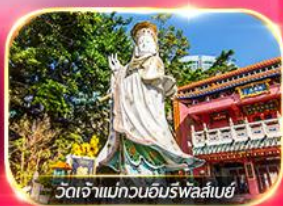
วัดเจ้าแม่กวนอิมรพัสเลนซ์