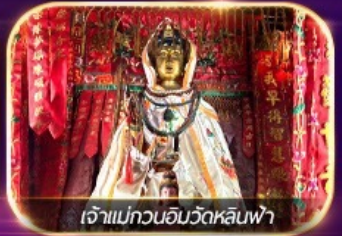
เจ้าแม่กวนอิมวัดหลินฟา

เต็มอิ่มทั้งบุญ และ ซ้อมปิ้งแบบจัดเต็ม จิมซาจุ่ย มงก๊ก