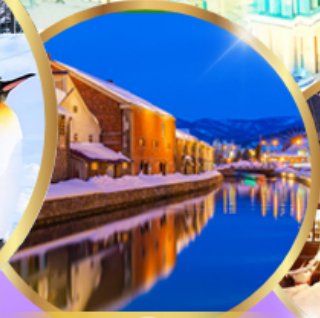
คลองโอตารุ