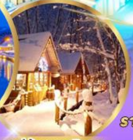
หมู่บ้านเทพนิยาย นิงเกิลเทอเรส