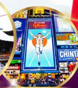
ช้อปปิ้ง ซินโซบาชิ

ราคา เดียว 49,919 บาท รวมภาษีมูลค่าเพิ่ม 7%