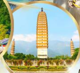
เจดีย์สามองค์