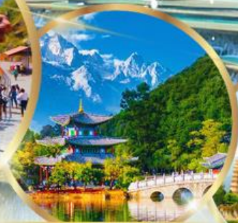
สระมิ่งกรดำ