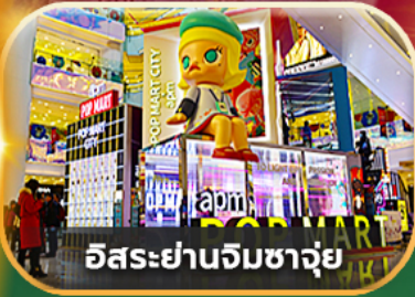
อิสระย่านจิมซาจุ่ย