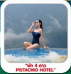
"พัก 4 ดาว PISTACHIO HOTEL"