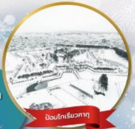
ป้อมโกเรียวกาคุ