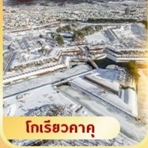
โกเรียวกาคู