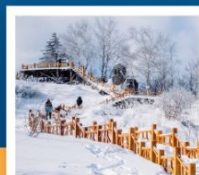
เขาเกาะหญ่