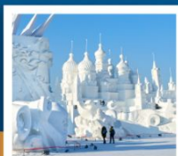
เกาะพระอาทิตย์