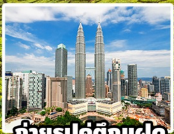
ถ่ายรูปคู่ตึกแฝด