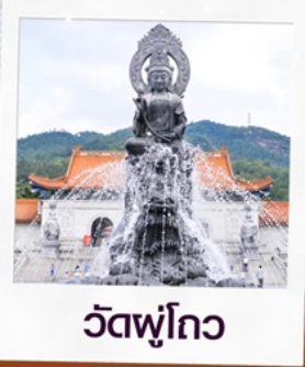
วัดฟูโกว