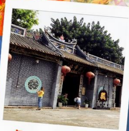
วัดกวนอูเซินเจิ้น