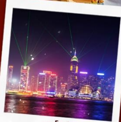
ชมโชว์ SYMPHONY OF LIGHT