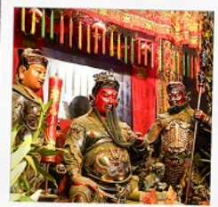
เทพเจ้ากวนอู วัดถุนไท