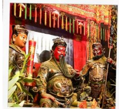
เทพเจ้ากวนอู วัดกวนไท