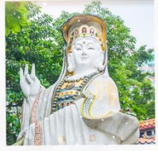
เจ้าแม่กวนอิมรพัสสิปีย์