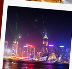
ชมโชว์ SYMPHONY OF LIGHT