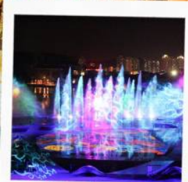
โชว์น้ำสามมิติ OCT BAY WATER SHOW