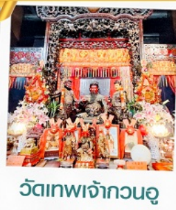
วัดเทพเจ้ากวนอู