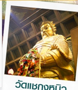
วัดเขาภกษิมิว