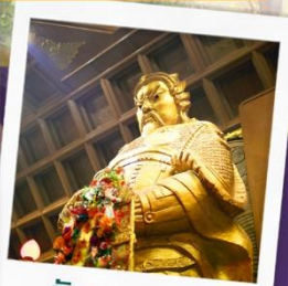
วัดเขากงหมิว