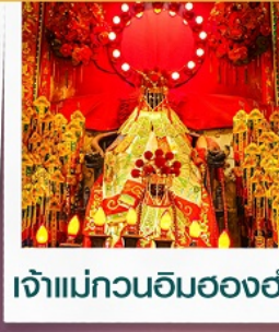
เจ้าแม่กวนอิมฮ่องกง