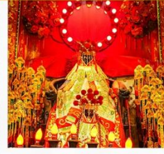
เจ้าแม่กวนอิมสองอ้า