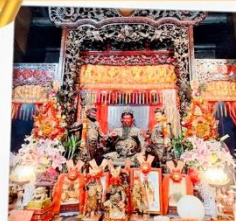
วัดเทพเจ้ากวนอู