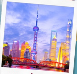
ทาดว่ายทาน