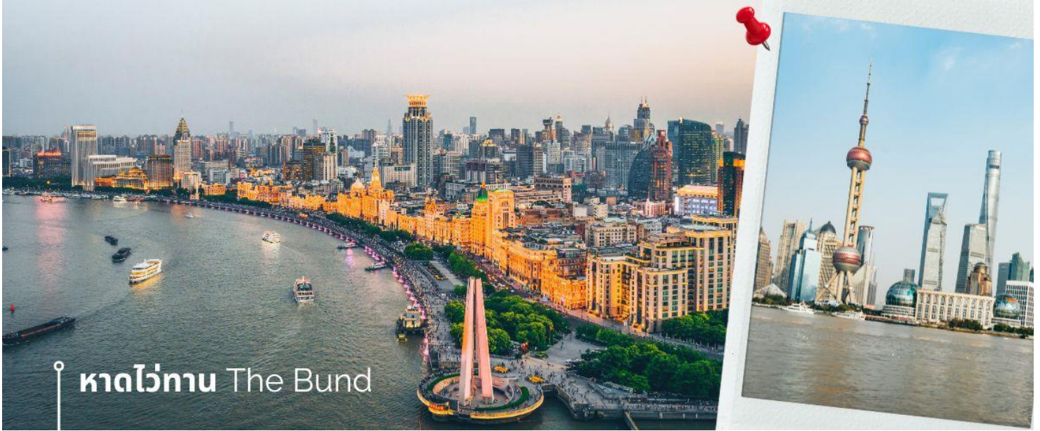
หาดไวทาน The Bund

นำท่านสู่บริเวณ หาดไวทาน ตั้งอยู่บนฝั่งตะวันตกของแม่น้ำหวงผู้มีความยาวจากเหนือจรดใต้ถึง 4 กิโลเมตรเป็นเขตสถาปัตยกรรมที่ได้ชื่อว่า “พิพิธภัณฑ์สิ่งก่อสร้างหมื่นปีแห่งชาตินจีน” ถือเป็นสัญลักษณ์ที่โดดเด่นของนครเซี่ยงไฮ้