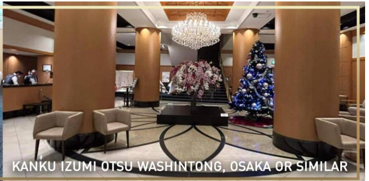
KANKU IZUMI OTSU WASHINTONG, OSAKA OR SIMILAR

วันที่ 5 สนามบินคันไซ – กรุงเทพฯ (ดอนเมือง)