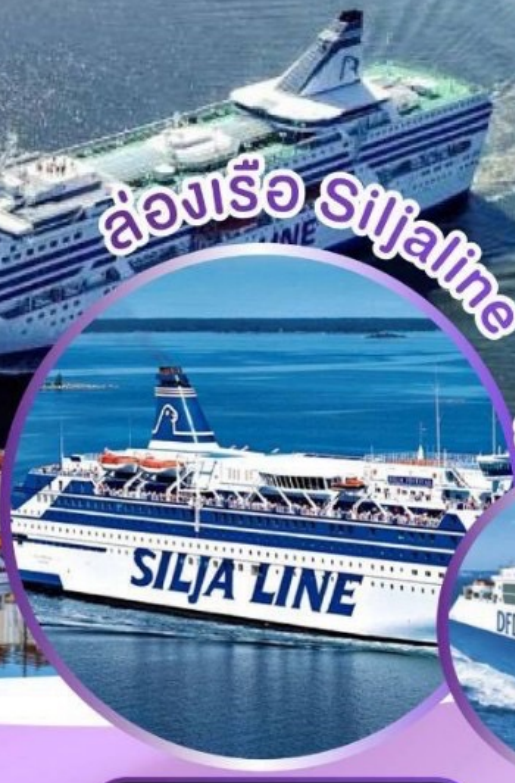
ล่องเรือ Siljaline

ล่องเรือและพักบนเรือสำราญ SILJALINE ล่องเรือและพักบนเรือสำราญ DFDS SEAWAY มีบีนภายในไม่ต้องนั่งรถไกล