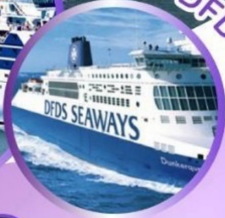
ล่องเรือ DFDS