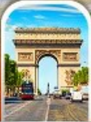
ARC DE TRIOMPHE FRANCE