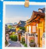
หมู่บ้านนูกซอน