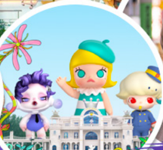
ช้อปบิง POP MART