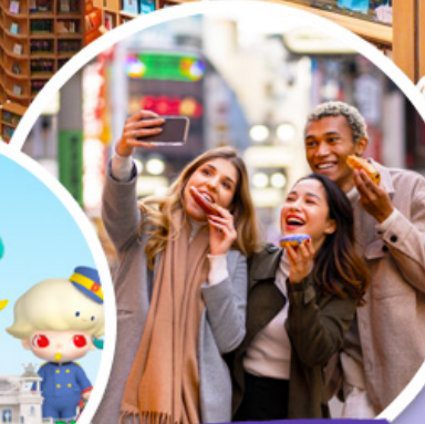
ตลาดเมียงดง