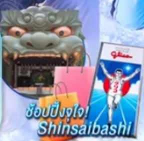
ช้อปปิ้งจุใจ! Shinsaibashi