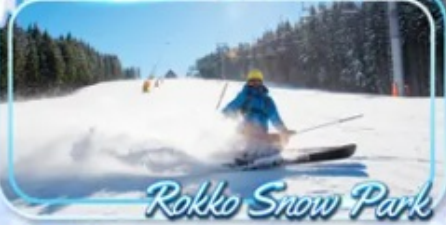
Rokko Snow Park