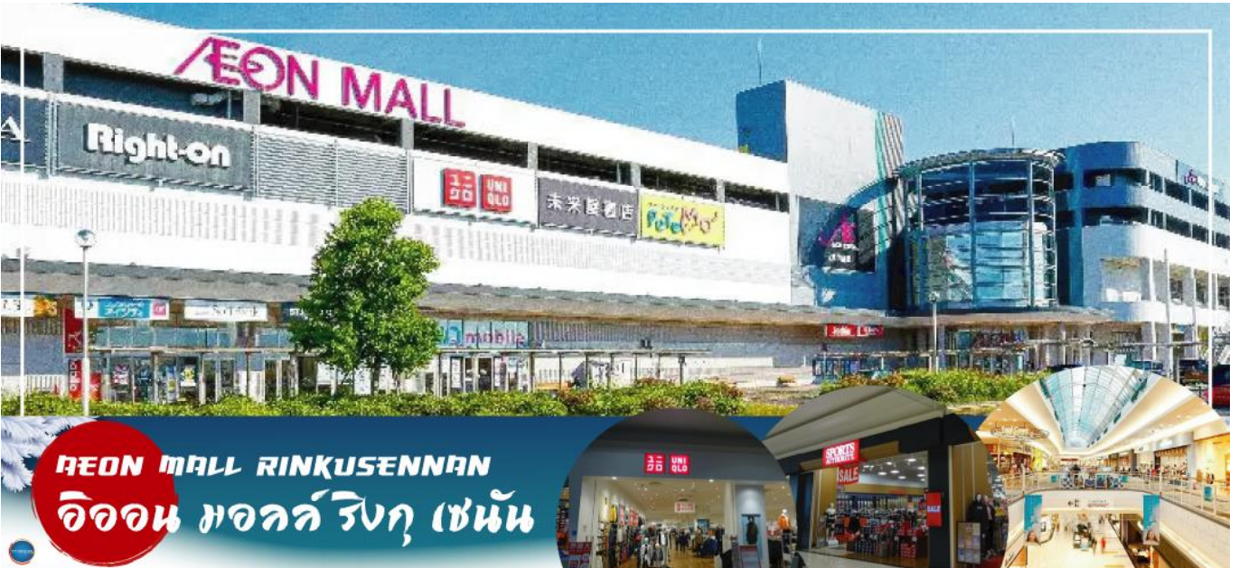
AEON MALL RINKUSENNAN อิออน มอลล์ ริงกุ เซนัน

เที่ยง อิสระรับประทานอาหารกลางวันตามอัธยาศัย นำท่านสู่ ห้างอิออน มอลล์ ริงกุ เซนัน (AEON MALL RINKUSENNAN) (ใช้เวลาเดินทางประมาณ 1 ชั่วโมง) จากห้างสามารถมองเห็นทิวทัศน์ของอ่าวโอซาก้า ความงามของพระอาทิตย์ตกดินที่นี่ถูกเลือกให้เป็น 100 สถานที่ชมพระอาทิตย์ตกดินที่ดีที่สุดของญี่ปุ่น นอกจากนี้ยังมีจตุรัสพรี