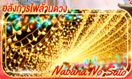
Nabana No Sato

รวมภาษีมูลค่าเพิ่ม 7% (ส่วนของค่าบริการเท่านั้น)