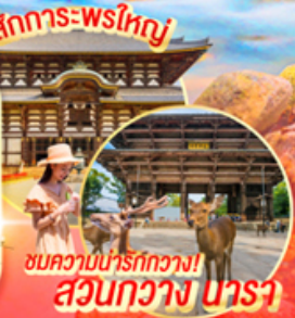
ชมความน่ารักทิวา! สวนกว้าง นารา

📍 ไฮไลท์!! อสังการไฟล้านดวง ณ หมู่บ้านนาบาระ โนะ ซาโตะ ชมไบโม่เปลี่ยนสีที่สวยงามที่สุดในภูมิภาค ณ หมู่เขาโคริงเค (ขึ้นกับฤดูกาล) สักการะ พระใหญ่โคบุทสึ แห่งเมืองนาราและชมความน่ารักของกวางบริเวณสวน ชมสวนสไตล์ญี่ปุ่น และเยือน วัดกิบะคุจิ หรือ วัดจิน แห่งเมืองเกียวโต ช้อปปิ้งจุใจ ณ MITSUI SHOPPING PARK LALAPORT SAKAI