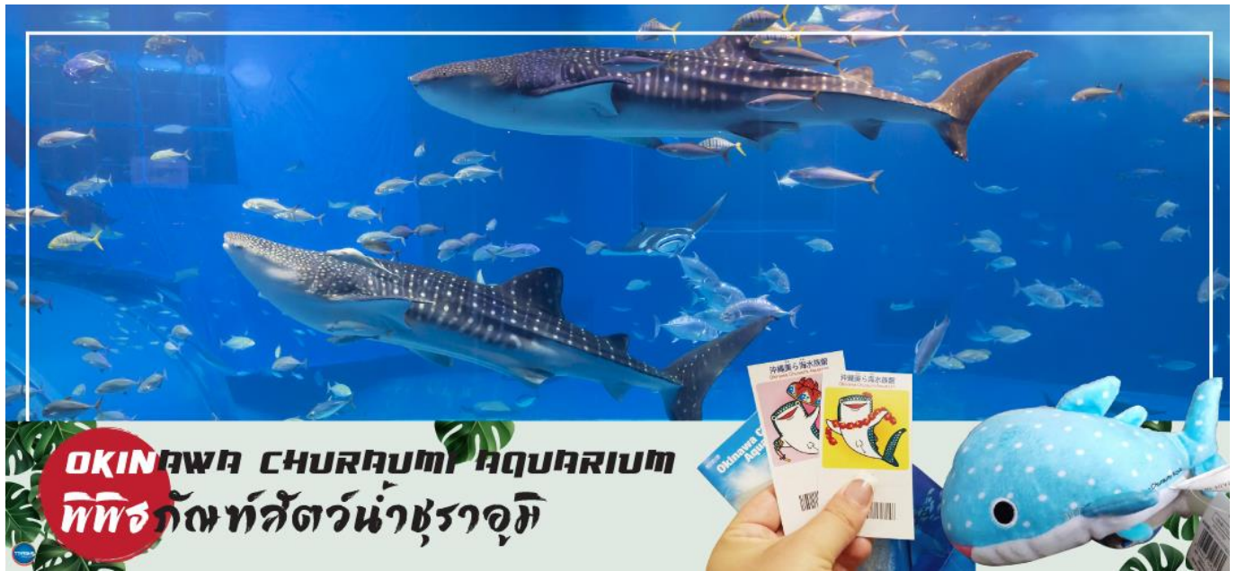
OKINAWA CHURAUMI AQUARIUM พิพิธภัณฑ์สัตว์น้ำชราอุมิ

เช้า รับประทานอาหารเช้า ณ ห้องอาหารของโรงแรม (1) นำท่านชม พิพิธภัณฑ์สัตว์น้ำชราอุมิ (OKINAWA CHURAUMI AQUARIUM) (ใช้เวลาเดินทางประมาณ 1.40 ชั่วโมง) เป็นพิพิธภัณฑ์สัตว์น้ำที่ดีที่สุดในประเทศญี่ปุ่น ไฮไลท์!!! ของการเยี่ยมชมพิพิธภัณฑ์สัตว์น้ำแห่งนี้คือแทงก์น้ำโครชิโอะ ซึ่งเป็นหนึ่งใน แทงก์น้ำที่ใหญ่ที่สุดของโลก ซึ่งภายในนั้นเต็มไปด้วยสิ่งมีชีวิตในทะเลแถบโอกินาวาที่หลากหลาย สัตว์น้ำที่โดดเด่นที่สุดคือฉลามวาฬยักษ์ และกระเบนราหู อีสระให้ท่านได้เพลิดเพลินกับสัตว์น้ำหลากหลายชนิด ทั้ง ปลาตาว ฉลาม ฉลามเสือ และฉลามวัว ปลาเรืองแสง ตลอดจนหอยต่างๆ นอกจากนี้ยังมีสระน้ำกลางแจ้งที่ตั้งอยู่ใกล้ริมน้ำซึ่งเป็นที่จัดการแสดงของโลมาแสนรู้ เต่าทะเล และพะยูน ที่จัดขึ้นเพียงไม่กี่ครั้งต่อวัน (ไม่มีค่าใช้จ่ายเพิ่มเติม แต่ต้องตรวจสอบเวลาการแสดงก่อนชมนะคะ)