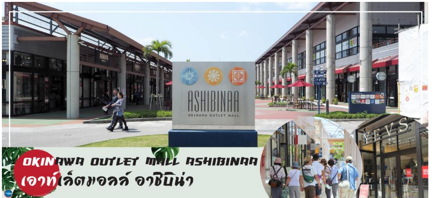
OKINAWA OUTLET MALL ASHIBINAA เอาท์เลตมอลล์ อาชิบิโน่า

จากนั้นนำท่านสู่ เอาท์เลตมอลล์ อาชิบิโน่า (Okinawa Outlet Mall Ashibinaa) (ใช้เวลาเดินทางประมาณ 30 นาที) เอาท์เลตแห่งแรกในโอกินาวะ รวบรวมร้านค้าชั้นนำกว่า 100 ร้าน ทั้งเสื้อผ้าแฟชั่น สินค้าแบรนด์เนม นาฬิกา ข้าวของเครื่องใช้ ของเล่น ทุกร้านจัดเต็มทั้งสินค้านำเข้าและรุ่นใหม่ ลดราคากระหน่ำกว่า 30-80% ให้ได้เดินช้อปปิ้งท้ายทวีปกันอย่างจุใจ ภายใต้บรรยากาศสบายๆ สไตล์รีสอร์ทริมทะเล หากช้อปปิ้งเหนื่อยสามารถขึ้นไปทานอาหารที่ชั้น 2 มีอีกหลายร้านที่คอยให้บริการ