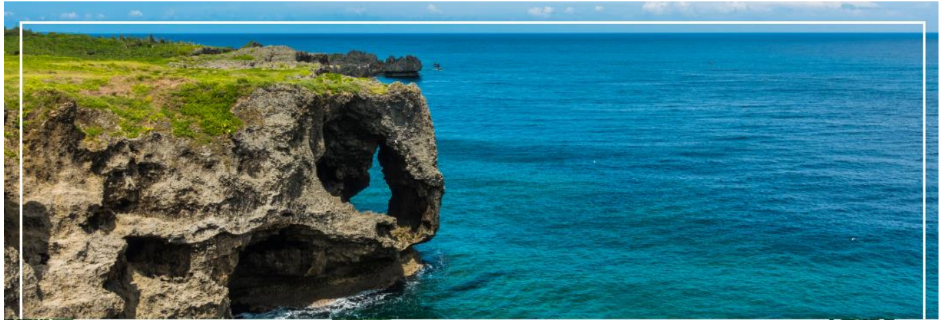
CAPE MANZAMO ผามันซาโมะ

เที่ยง รับประทานอาหารกลางวัน ณ ภัตตาคาร (2)