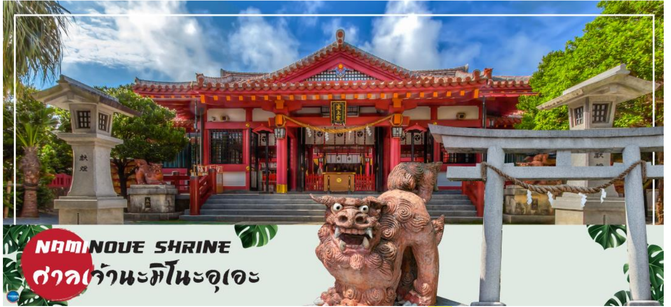
NAMINOUE SHRINE ศาลเจ้ามิโนะอุเอะ