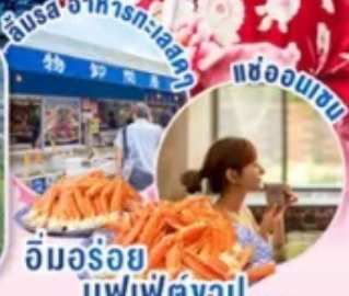
อิมอร้อย บุฟเฟ่ต์งาปู...

ไฮไลท์!! นั่งกระเช้าชมวิวทิวทัศน์ขึ้นภูเขา Omuro (ตามรอยอนิเมะชื่อดัง) ชมซากุระ ณ หมู่บ้านโอชิโนะฮักโกะ วิวภูเขาไฟฟูจิสวยงามติดกับพื้นหลังสีฟ้า เทียว เมืองอาโอยุ จ.อิบารากิ เมืองซายาฮาดทะเลญี่ปุ่นตะวันออก ช้อปปิ้งใจ ชินจูกุ พร้อมเช็คอิน แลนด์มาร์คแห่งใหม่ แมวยักษ์ 3 มิติ บุฟเฟ่ต์งาปู และผ่อนคลายกับการแช่น้ำแร่ธรรมชาติ (ออนเซน)