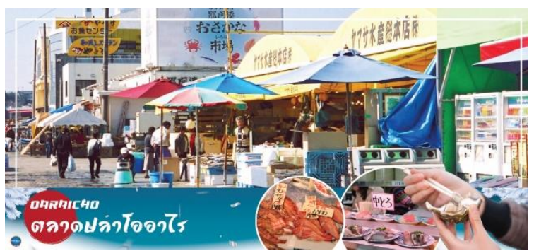
ORAICHO ตลาดปลาโออาริ

อิมพอร์ตกับอาหารทะเลสดใหม่ส่งตรงมาจากท่าเรือประมงโออาริ อาทิ ข้าวหน้าปลาดิบ หรืออาหารทะเลปิ้งย่าง นอกจากนี้ยังมีอาหารทะเลตากแห้งที่ทำเองโดยชาวประมง ซึ่งเหมาะสำหรับเป็นของฝากอีกด้วย อีสระรับประทานอาหารทะเลสดๆ แบบปิ้งย่าง เพลิดเพลินกับหลากหลายเมนูปลาสดๆ เช่น ปลาอังโค ปลาชิราสุ (ปลาข้าวสาร) ตามแต่ฤดูกาล หอยเชลล์ หอยตลับ หอยนางรม หมึกย่างเนย และกุ้ง เป็นต้น