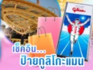
เช็กอิน... ปายกุสึโกะแมน