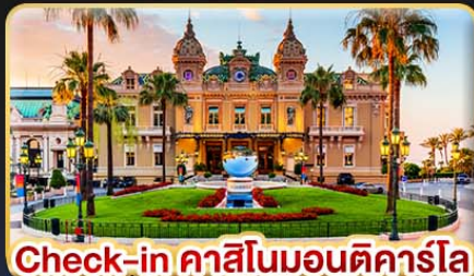
Check-in คาสิโนมอนติคาร์โล