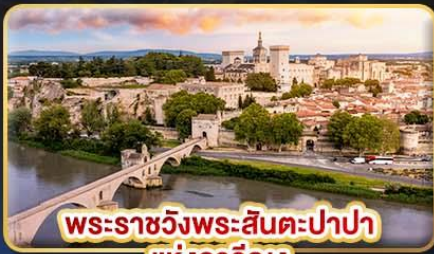
พระราชวังพระสันตะปาปา แห่งอเวัญง