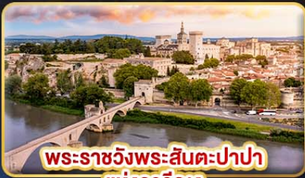
พระราชวังพระสันตะปาปา แห่งอาวิญง