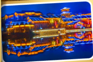
Oriental Salt Lake City