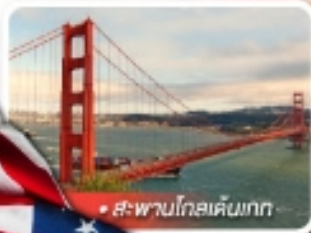
สะพานโกลเด้นเกต