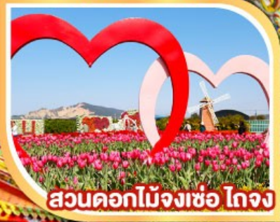
สวนดอกไม้จงเซอ ไจง