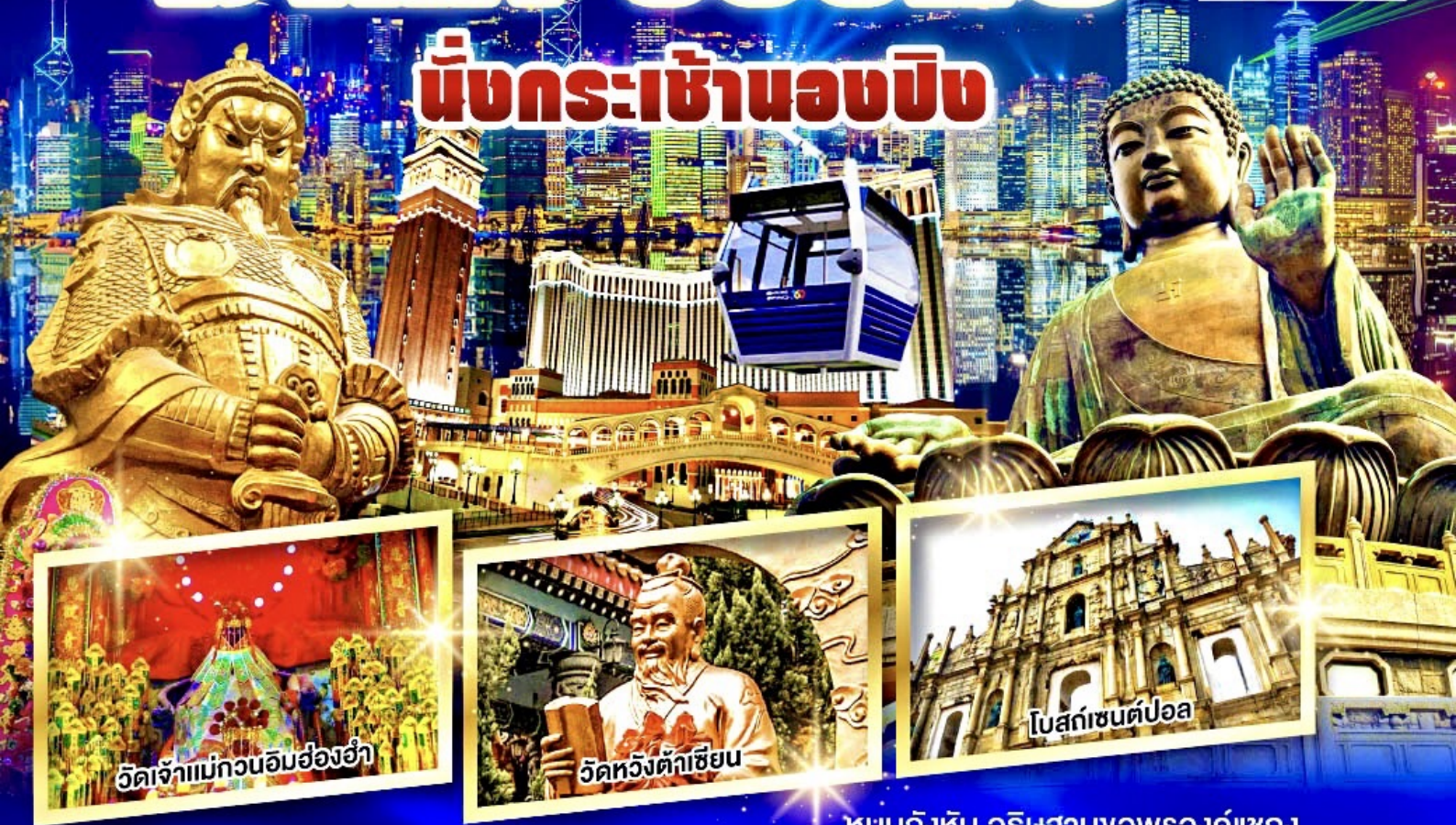
วัดเจ้าแม่กวนอิมฮ่องฮ่า