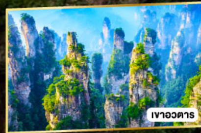
เวาอวดาร