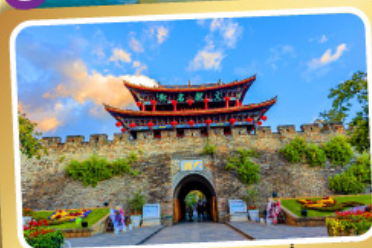
เมืองโบราณต้าหลี่