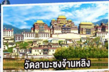
วัดลามะซงจ่ามหลี่