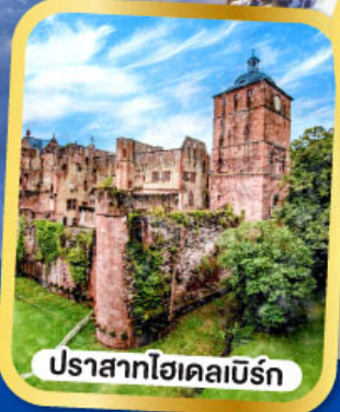
ปราสาทไฮเคลเบิร์ก