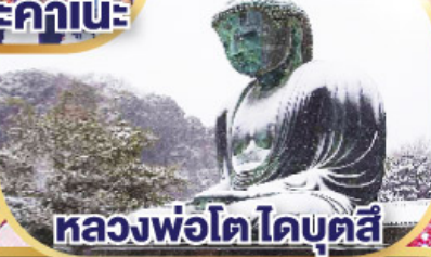
หลวงพอโตโดบตล