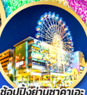
ช้อปปิ้งย่านซากาเอะ