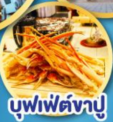
บุฟเฟ่ต์จางู