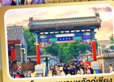
ถนนโบราณหนานหลิวกู่เซียง