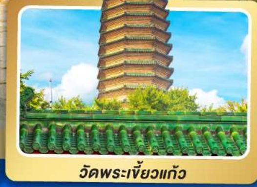
วัดพระเจี้ยวแก้ว

เมนูพิเศษ เปิดปักกิ่ง, ชาบูหม้อไฟ อาหารกวางตุ้ง, อาหารเสฉวน