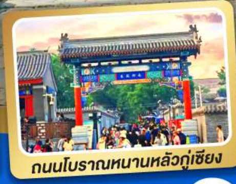
ถนนโบราณหนานหลวู่เซียง