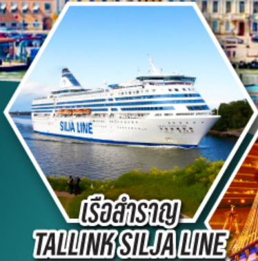
เรือสำราญ TALLINK SILJA LINE