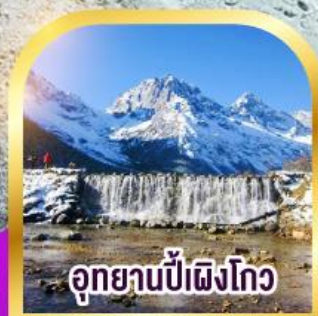
อุทยานปี่เผิงโกว