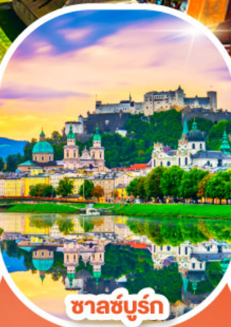
ซาลซ์บูร์ก