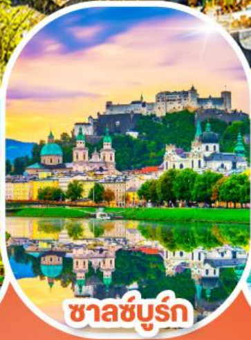
ซาลซ์บูร์ก