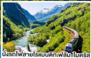
นั่งรถไฟสายโรแมนติกฟลัมส์โบคริส